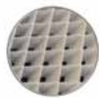
Tabella di selezione rapida

griglia porta filtro a maglia quadra INCLINATA a 45° costruz. a filo e contro cornice di alloggiamento filtro.