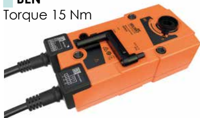
BEN Torque 15 Nm