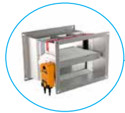
FDSD Singolo compartimento