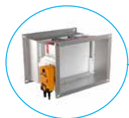
FDSD Singolo compartimento