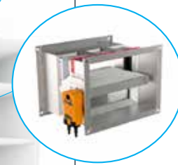
FDSD Multi compartimento

Condotto tagliafumo a più scomparti con isolamento antincendio