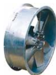
Versione estrazione fumi